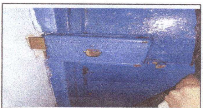
Foto 6 Cambio de chapa porque no pone ni quita llave

Observación: Si es necesario se pueden agregar hojas adicionales y actualizar el número de hojas.