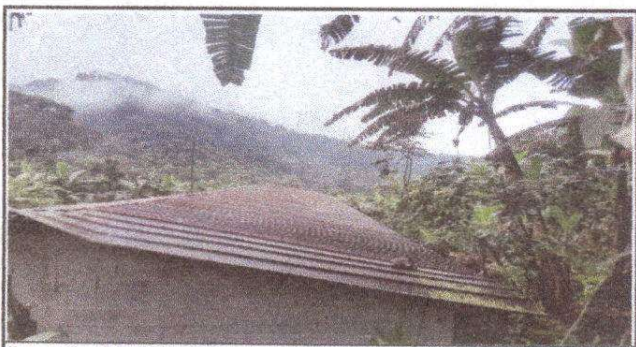
Foto 5 Cambio de lámina por ingreso de agua en época de lluvia