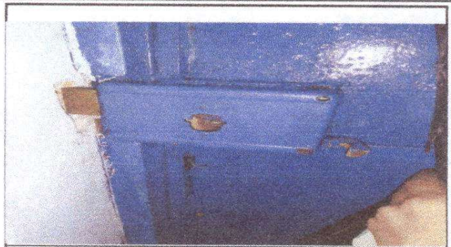
Foto 2 Cambio de chapa porque no pone ni quita llave