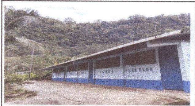
Foto 3 Cambio de canal de agua por deterioro del existente