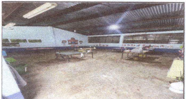
Foto 4 Cambio de lámparas por poca iluminación